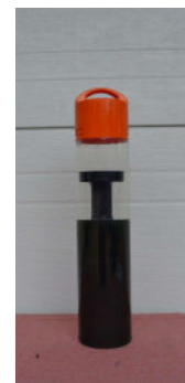
Einwirkzeit 4 Std.