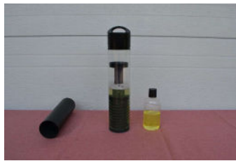
SD zerlegen und einstellen