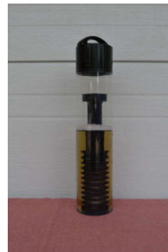
Einwirkzeit 1 Std.