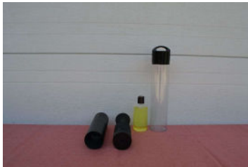
Set vorbereiten, Hülle leeren

Zugängliche Stellen wie die Innenseite des Hüllrohres können mit dem beigelegten Mikrofasertuch abgereinigt werden. Nach dem Reinigungsvorgang spülen sie den Schalldämpfer kräftig mit klarem Wasser. Durch Schütteln und Klopfen können sich noch Schmutzrückstände lösen. Abschließend trocknen sie den Schalldämpfer, bevor sie ihn wieder zusammenbauen. Materialverträglichkeit vor der Anwendung prüfen!