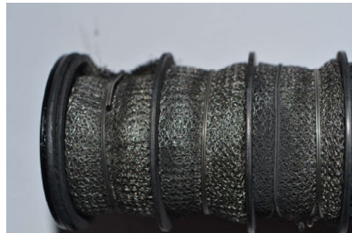
Schalldämpfer VOR der Reinigung